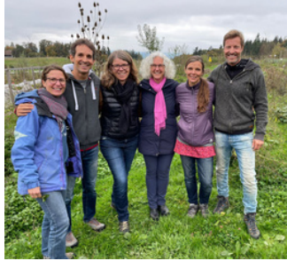
Das Glück-Hof Kern-Team und die Betriebsgruppe der SOLAWI

* Solidarische Landwirtschaft (SOLAWI) beruht darauf, dass die Produktion von den Konsument:innen mitgetragen wird. Sie beteiligen sich aktiv an der Entscheidung und Planung, was und wie produziert werden soll. Durch die praktische Mitarbeit auf dem Land wird die Wertschätzung für die bäuerliche Arbeit, für die Lebensmittel und für die Natur gefördert. SOLAWI kennt keine Produktpreise sondern finanziert direkt die landwirtschaftliche Produktion. Die Konsument:innen bezahlen einen einmaligen Genossenschaftsbeitrag sowie Jahresbeiträge, welche sich am persönlichen Bedarf orientieren. Dies ermöglicht eine Risikoteilung und entlastet die Landwirt:innen vom Preisdruck. Ohne Zwischenhandel kommen die Nahrungsmittel frisch vom Feld zu den Konsument:innen.